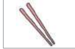
젓가락 চপ স্টিক