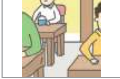
자리가 없다 জায়গা নাই