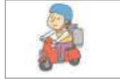
배달하다 পার্সেল করা