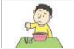
맛없다 মজা না