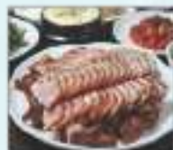
족발 শুকরের পা