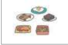
반찬 সাইড ডিশ