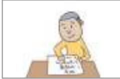
고르다 বাছাই করা