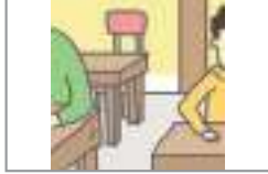
자리가 있다 জায়গা আছে

রেস্তোঁরায় খাওয়া বিষয়ক অভিব্যক্তি গুলো জানেন? আসুন একসাথে দেখি।