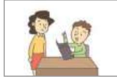
시키다(주문하다) অর্ডার করা