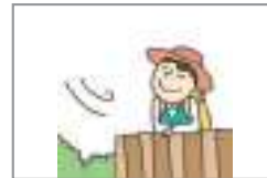
상쾌하다 ফুরফুরে লাগা