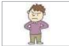
기분이 나쁘다 মন খারাপ