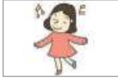
기분이 좋다 মন ভালো

মন-মেজাজ ও আবেগ প্রকাশ করতে কোন কোন অভিব্যক্তি আছে শিখে নেই?