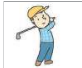
골프를 치다 গলফ খেলা