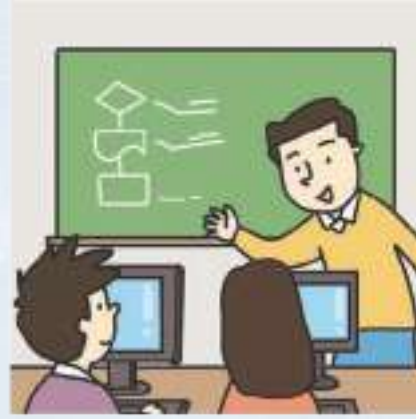
컴퓨터 수업 কম্পিউটার ক্লাশ