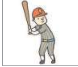
야구하다 বেসবল খেলা