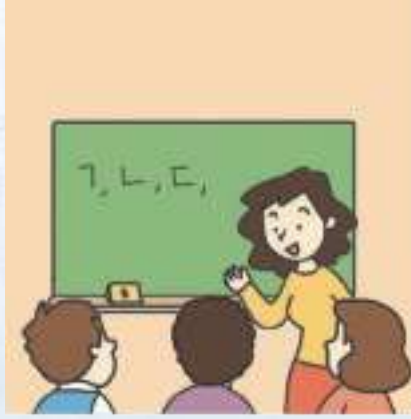
한국어 수업 কোরিয়ান ক্লাশ

বিভিন্ন স্থানে কল্যাণ কেন্দ্র, বিদেশী শ্রমিক কেন্দ্র, বিদেশী সহায়তা কেন্দ্র, বহুসংস্কৃতি সহায়তা কেন্দ্র ইত্যাদি থেকে বিদেশীদের জন্য আনন্দময় কোরিয়ান জীবনযাত্রা বিষয়ক শিক্ষামূলক প্রোগ্রাম ব্যবস্থা করা হয়। কোরিয়ান শিক্ষা, কম্পিউটার, থ্যাকুয়ন্দো প্রোগ্রামের মাধ্যমে শখের বিভিন্ন কার্যক্রম উপভোগ করা যায়।