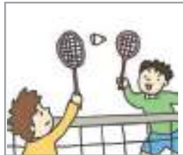
배드민턴을 치다 ব্যাডমিন্টন খেলা