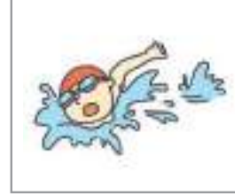
수영하다 সাতার কাটা