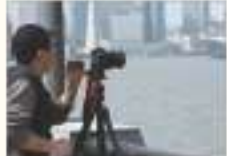
사진 동호회 ছবি তোলা ক্লাব