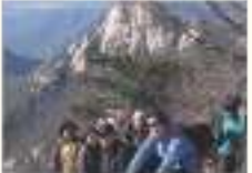
등산 동호회 পাহাড় চড়ার ক্লাব