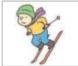
스키를 타다 স্কিইং করা