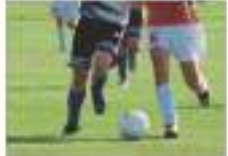
축구 동호회 ফুটবল ক্লাব

같은 취미를 가진 사람들이 취미 활동을 같이 하는 모임입니다. একই শখ এমন মানুষদের শখের কার্যকলাপ একসাথে করার গ্রুপ