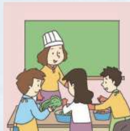
요리 수업 রান্নার ক্লাশ