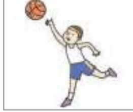
농구하다 বাস্কেটবল খেলা