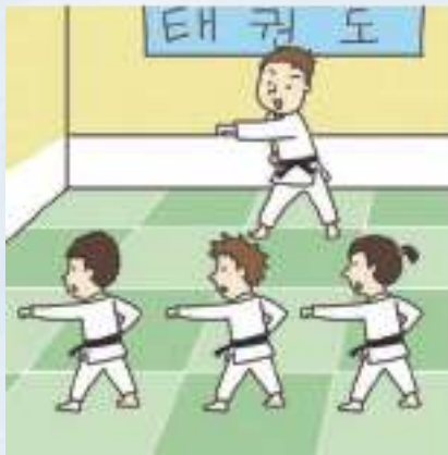
태권도 수업 থ্যাকুয়ন্দো ক্লাশ