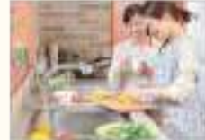
요리 동호회 রান্নার ক্লাব