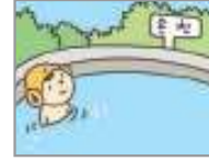
온천 গরম পানির আধার