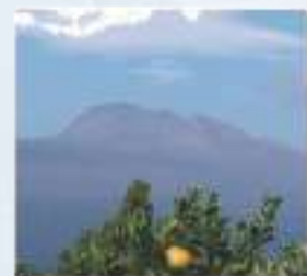
한라산 হান্না পাহাড়

알아 두세요! 외국인력지원센터의 단체 여행 জেনে রাখুন! বিদেশী সহায়তা কেন্দ্রের সম্মিলিত ভ্রমণ