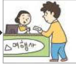
표를 사다 টিকেট কেনা