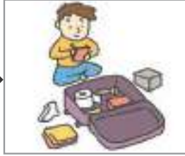
여행을 준비하다 ভ্রমণের প্রস্তুতি