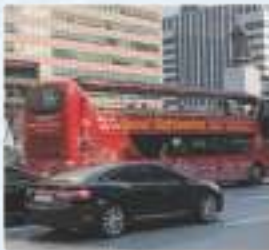
서울 시티투어 সউল শহর ভ্রমণ