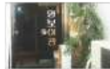
여관 ঐতিহ্যবাহী হোটেল