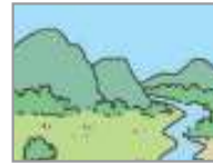
경치가 좋다 সুন্দর দৃশ্যপট