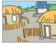
민속촌 ফোক ভিল্যাজ