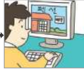
숙소를 예약하다 খাকার জায়গা বুকিং দেয়া