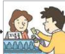
기념품을 사다 সুউেনির কিনা