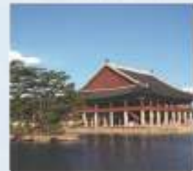
경복궁 গিয়ংবুকগুং প্রাসাদ