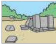
유적지 ঐতিহাসিক স্থান