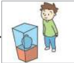
박물관을 관람하다 যাদুঘর দেখা