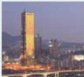
63빌딩 ৬৩ বিল্ডিং