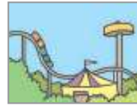
놀이공원 বাচ্চাদের খেলার স্থান