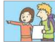
사람들이 친절하다 মানুষগুলো বন্ধুত্বপূর্ণ