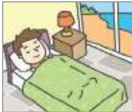
묵다 থাকা (নিজের বাড়ি নয়, হোটেল ইত্যাদিতে)