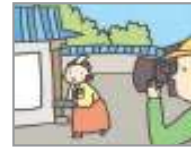
드라마 촬영지 নাটক করার স্পট