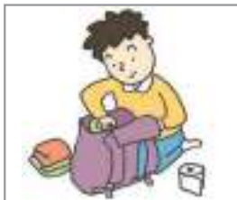
짐을 싸다 প্যাক আপ