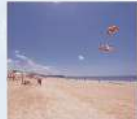
대천 해수욕장 দ্যাছন সমুদ্র সৈকতে অবস্থিত গোসলের স্থান