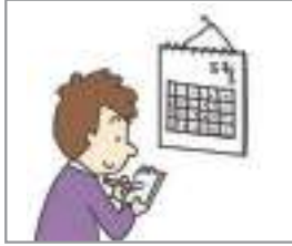
여행을 계획하다 ভ্রমণ পরিকল্পনা

ভ্রমণের প্রস্তুতির সময় ব্যবহৃত অভিব্যক্তি ও অবসর কার্যক্রম সম্পর্কিত অভিব্যক্তি গুলো শিখে নেই?