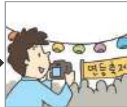
축제를 구경하다 উৎসব উদযাপন করা