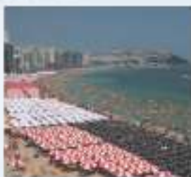
해운대 হ্যাউন্দে সমুদ্র সৈকত