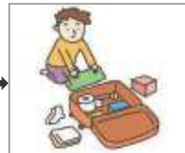
짐을 풀다 মালামাল নামানো