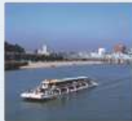
한강 유람선 হান নদীর ক্রুজ