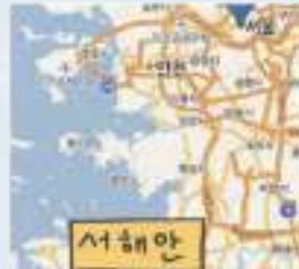
서해안 পশ্চিম উপকূল