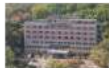
유스호스텔 যুব ছাত্রাবাস