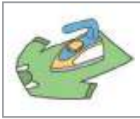
옷을 다리다 কাপড় লন্ড্রি করা