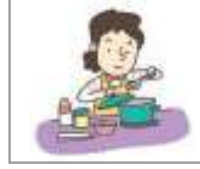
음식을 만들다 খাবার তৈরি করা