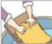
빨래를 하다 কাপড় পরিষ্কার করা