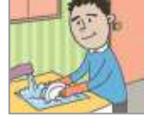
설거지를 하다 খালা বাসন ধুয়ে ফেলা