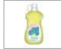
주방 세제 কিচেন ডিটারজেন্ট