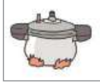
밥을 하다(짓다) ভাত রান্না করা