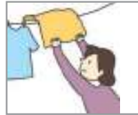
빨래를 널다 কাপড় নেড়ে দেওয়া