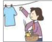
빨래를 건다 শুকানো কাপড় আনা