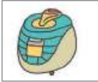
밥솥 রাইস কুকার