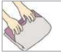
옷을 개다 কাপড় ভাঁজ করা