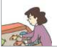
장을 보다 মুদি বাজার করা

ঘরের কাজের সাথে সম্পর্কিত কিছু অভিব্যক্তি দেখে নেয়া যাক?