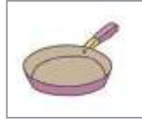
프라이팬 ফ্রাই প্যান