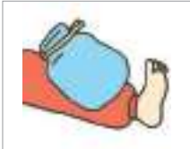
찜질을 하다 ঠান্ডা/গরম স্যাক দেয়া