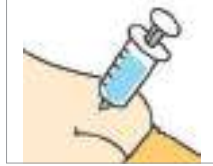
주사를 맞다 ইঞ্জেকশন নেয়া