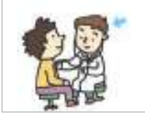
치료를 하다 চিকিৎসা করা

চিকিৎসা সম্পর্কিত কিছু অভিব্যক্তি কি কি?