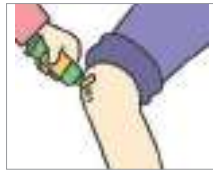
연고를 바르다 মলম লাগানো