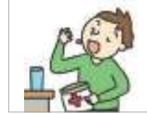
약을 먹다 ওষুধ খাওয়া