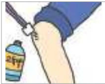
소독을 하다 জীবাণুমুক্ত করা