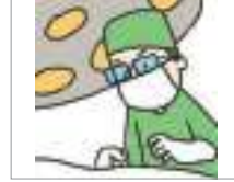
수술하다 সার্জারি করা