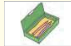
필통 পেন্সিল বাক্স