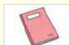
공책 নোটবুক (খাতা)