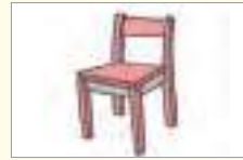
의자 চেয়ার (কেদারা)