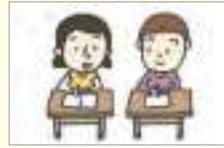
반 친구 সহপাঠী