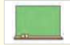
칠판 লেখার বোর্ড