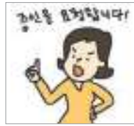
요구하다 দাবি করা