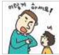
강요하다 বাধ্য করা