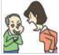
성범죄 যৌন নিপীড়ন

আসুন দেখি যৌন হয়রানি সম্পর্কিত অভিব্যক্তি কি কি আছে।