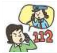
신고하다 রিপোর্ট বা অভিযোগ করা