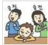
불이익을 주다 অসুবিধা করা