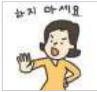
의사를 표현하다 মনোভাব প্রকাশ করা