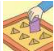
적재하다 লোড করা