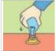
끼우다 প্রবেশ করানো (ইনসার্ট)