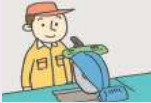
작동하다 অপারেট করা

가: 이거 어떻게 작동하는지 알아요? 좀 가르쳐 주세요. এটা কিভাবে কাজ করে জানেন? একটু শিখিয়ে দিন।