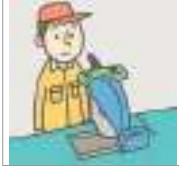
작동하다 অপারেট করা

মেশিন অপারেশন বিষয়ক কোন কোন অভিব্যক্তি গুলি আছে একবার ভাল করে দেখে নিই?