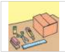
제작하다 উৎপাদন করা