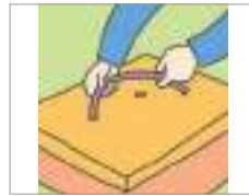
조절하다 নিয়ন্ত্রণ করা