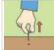
빼다 বের করা