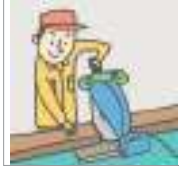
사용하다/쓰다 ব্যবহার করা