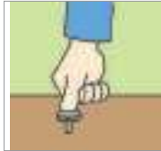
꽂다 প্লাগ ইন (ঢুকানো)