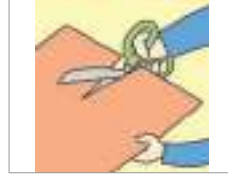
오리다 কেটে তুলে ফেলা