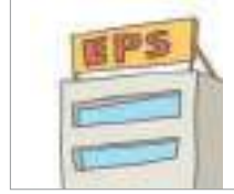
고용허가제 এমপ্লয়মেন্ট পারমিট সিস্টেম