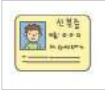
신분증 আইডি কার্ড

আসুন আমরা ইপিএস-টপিক সম্পর্কিত অভিব্যক্তি গুলো কি কি আছে দেখে নিই।