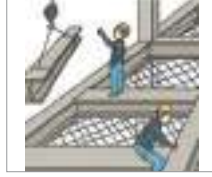
건설업 নির্মাণ শিল্প