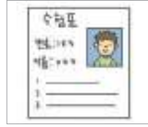
수험표 পরীক্ষার এডমিট কার্ড