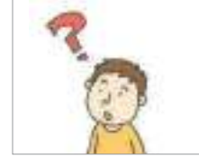
문의하다 জিজ্ঞাসা করা