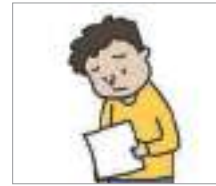
불합격하다 ফেল করা