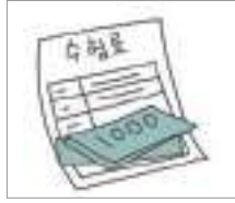
수험료 পরীক্ষার ফি