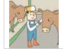
축산업 প্রাণিসম্পদ শিল্প