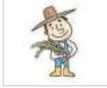
농업 কৃষি শিল্প