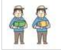
제조업 উৎপাদন শিল্প

নিম্নে এমপ্লয়মেন্ট পারমিট সিস্টেম সম্পর্কিত বিভিন্ন এক্সপ্রেশন রয়েছে। আসুন দেখি কি কি আছে।