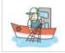
어업 মৎস্য শিল্প