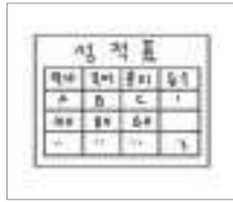
성적표 রিপোর্ট কার্ড