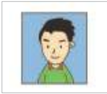
증명 사진 আইডি ফটো