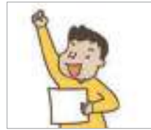
합격하다 পাস করা