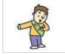
서비스업 সেবা শিল্প