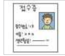
접수증 আবেদনের প্রমাণ পত্র