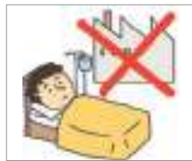
결근하다 কাজে অনুপস্থিত থাকা