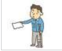
병가 মেডিকেল ছুটি

মেডিকেল ছুটির আবেদন কিভাবে করা যায়? আসুন মেডিকেল ছুটি সংক্রান্ত শব্দকোষ দেখি।