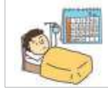
병가 기간 মেডিকেল ছুটির সময়কাল