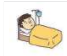
입원을 하다 হাসপাতালে ভর্তি হওয়া