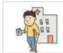
통원 치료를 하다 হাসপাতালে আসা-যাওয়া করে চিকিতসা করা