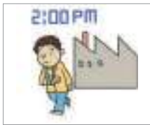
조퇴하다 নির্ধারিত সময়ের আগে ছুটি করা