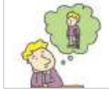
병가 사유 মেডিকেল ছুটির কারণ