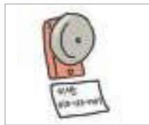
비상 연락처 জরুরী ফোন নাম্বার