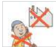
무단결근하다 অনুমতি ছাড়া কাজে অনুপস্থিত থাকা