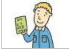
체류 자격 ভিসা স্ট্যাটাস

ভিসা স্ট্যাটাস কীভাবে অর্জন করা যায়? আসুন ভিসা স্ট্যাটাস সম্পর্কিত শব্দগুলো দেখি।