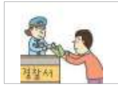
벌금을 내다 জরিমানা দেয়া