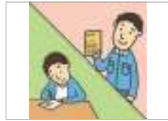
자격을 획득하다 স্ট্যাটাস অর্জন করা