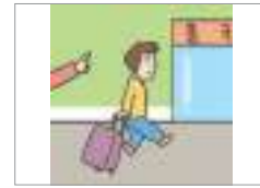
자진 출국하다 স্বেচ্ছায় দেশ(কোরিয়া) ত্যাগ করা।