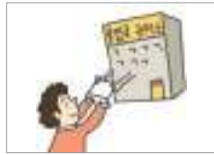
자격을 부여하다 স্ট্যাটাস দেয়া