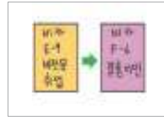
자격을 변경하다 স্ট্যাটাস পরিবর্তন করা