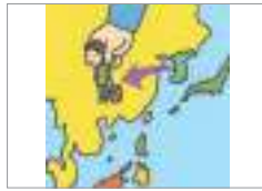
강제 출국을 당하다 জোরপূর্বক বহিষ্কারের শিকার হওয়া