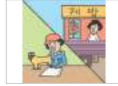
체류 자격 외 활동 ভিসা স্ট্যাটাসের বাইরে কাজ করা