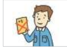
불법 체류 অবৈধভাবে বসবাস