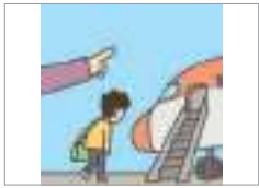
추방되다 দেশ থেকে বহিষ্কৃত হওয়া