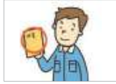
합법 체류 বৈধভাবে বসবাস