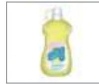
주방 세제 សាប៊ូលាងចាន