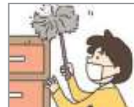
먼지를 떨다 បោសធ្នូលី