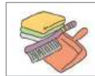
청소 도구 ឧបករណ៍បោសសម្អាត