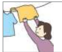
빨래를 널다 ហាលសំលៀកបំពាក់