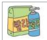
세탁세제 សាប៊ូបោកសំលៀកបំពាក់