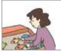
장을 보다 ទៅផ្សារ

តោះ! ទៅមើលទាំងអស់គ្នាថាមានពាក្យអ្វីខ្លះដែលទាក់ទងនឹងការងារផ្ទះ?