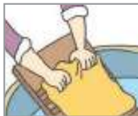
빨래를 하다 បោកសំលៀកបំពាក់