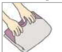
옷을 개다 បត់សំលៀកបំពាក់