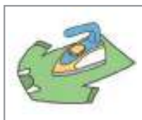
옷을 다리다 អ៊ុតសំលៀកបំពាក់