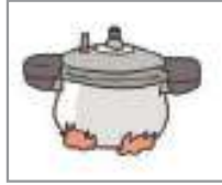
밥을 하다(짓다) ដាំបាយ