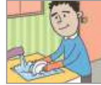
설거지를 하다 លាងចាន