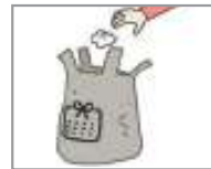
쓰레기를 버리다 បោះចោលសំរាម