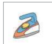
다리미 ឆ្នាំងអ៊ុតសំលៀកបំពាក់