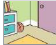
정돈되어 있다 មានសណ្តាប់ធ្នាប់