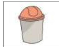
휴지통 ធុងសំរាម