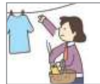
빨래를 걷다 សាសំលៀកបំពាក់