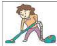
청소기를 돌리다 ប្រើម៉ាស៊ីនបូមធ្នូលី