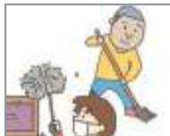
청소를 하다 បោសសម្អាត