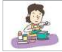
음식을 만들다 ធ្វើម្ហូប