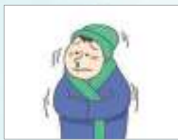
감기약 ថ្នាំផ្តាសាយ

ប្រសិនបើនៅកណ្តាលអាធ្រាត ឬក៏ថ្ងៃបុណ្យឈប់សម្រាក ប៉ុន្តែអ្នកស្រាប់តែត្រូវការទិញថ្នាំ ហើយបើសិនជាឱសថស្ថានបិទទ្វារទៀតនោះ អ្នកអាចទិញថ្នាំសង្គ្រោះបន្ទាន់នៅឯម៉ាតឯងបាន។ នៅម៉ាតឯងម៉ែង គឺមានថ្នាំផ្សេងៗជាច្រើនដូចជា៖ ថ្នាំផ្តាសាយ ថ្នាំរំលាយអាហារ ថ្នាំបំបាត់ការឈឺចាប់ ថ្នាំបញ្ចុះកម្ដៅ កៅអៀក ថ្នាំលាបជាដើម។