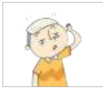
열이 나다 ក្តៅខ្លួន