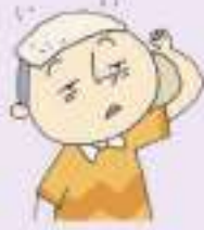
열이 많이 나다 ក្តៅខ្លួនខ្លាំង