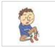
발목을 삐다 ច្រូតកជើង