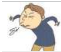
기침을 하다 ក្អក