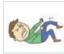
다리가 부러지다 បាក់ជើង