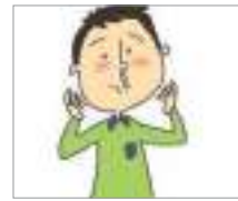
코물이 나다 ហៀរសំបោរ