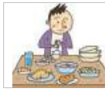
소화가 안 되다 ពិបាកលាយអាហារ (ក្រពះមិនស្រួល)