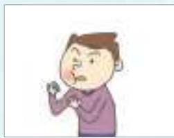
진통제 ថ្នាំបំបាត់ការឈឺចាប់