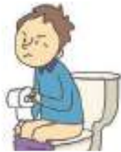
계속 설사를 하다 រាគរហូត