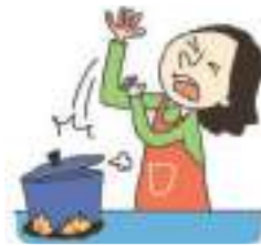
손을 데었다 លោកដៃ