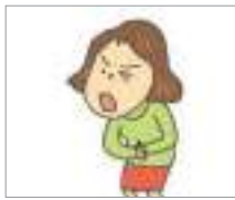
배탈이 나다 ឈឺពោះ(មិនស្រួលពោះ)