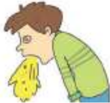
계속 토하다 ក្អករហូត