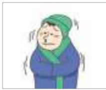
감기에 걸리다 ផ្កាសាយ

តោះ! យើងមើលពាក្យដែលពាក់ព័ន្ធនឹងរោគសញ្ញាទាំងអស់គ្នា។