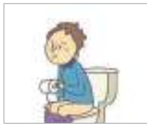
설사를 하다 រាត