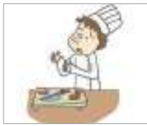
손을 베다 មុតដៃ