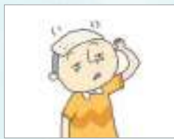
해열제 ថ្នាំបញ្ចុះកម្ដៅ