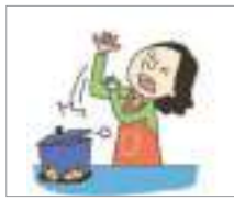
손을 데다 រលាកដៃ