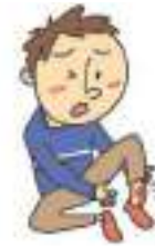
발목을 삐었다 ត្រចកកង្កើង