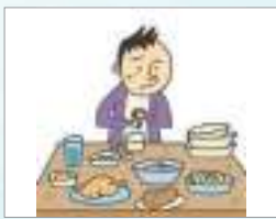
소화제 ថ្នាំរំលាយអាហារ