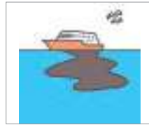
폐유 កាកសំណល់ប្រេង