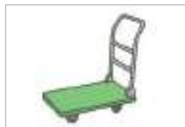
손수레 រទេះរុញ(ដោយប្រើដៃ)