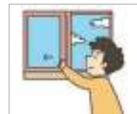
환기하다 ផ្លាស់ប្តូរខ្យល់ចេញចូល