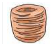
비닐 끈 ខ្សែប្លាស្ទិក