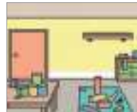
엉망이다 រញ្ជ័ររញ្ជ័