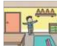
정리가 잘 되어 있다 រៀបចំបានល្អ