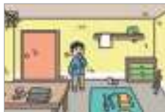
냄새가 심하다 ជុំភ្លិនខ្លាំង