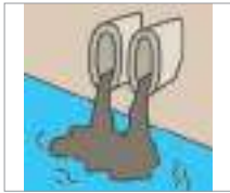
폐수 កាកសំណល់ទឹក(រាវ)