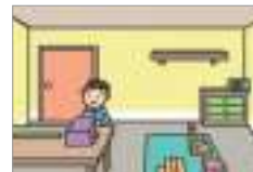
쾌적하다 មានជាស្មុកភាព