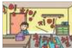
소음이 심하다 មានសម្លេងរំខានខ្លាំង