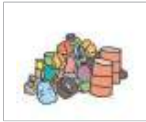
폐기물 កាកសំណល់រឹង

តោះយើងស្វែងយល់ពីពាក្យដែលជាប់ទាក់ទងនឹងកាកសំណល់និងការរៀបចំសម្អាតឧបករណ៍ប្រើប្រាស់ទាំងអស់គ្នា។