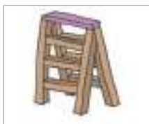
사다리 ជណ្តើរ(មានជើង)