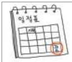
종강 end of the semester