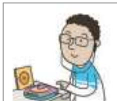
CD를 듣다 to listen to a CD