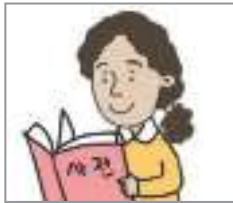
사전을 찾다 to look up (a word) in a dictionary