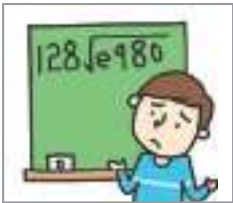
어렵다 to be difficult