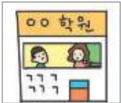
학원에 다니다 to go to an academy