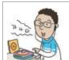
따라하다 to repeat after