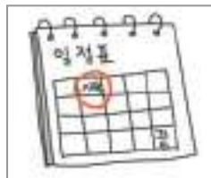
개강 beginning of the semester