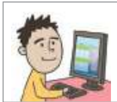
인터넷 강의를 듣다 to take online courses