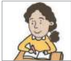
공부하다 to study

How do you study Korean? Let's find out the vocabulary related to study.