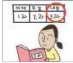
예습하다 to preview