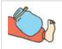
찜질을 하다 to apply ice