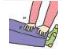
주무르다 to massage