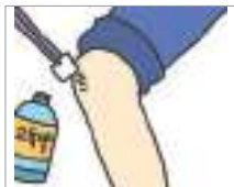
소독을 하다 to disinfect