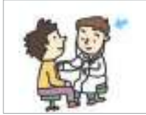
치료를 하다 to treat

Let's find out about expressions related to treatment.