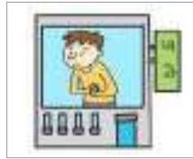
내과 internal medicine/clinic

Let's find out about the vocabulary related to hospitals.