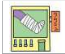
정형외과 orthopedic clinic