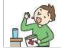
약을 먹다 to take medicine