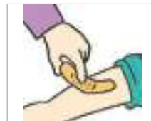
밴드를 붙이다 to put on a band-aid