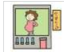
산부인과 ob/gyn (obstetrics+gynecology)