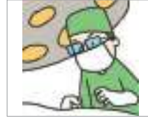
수술하다 to have surgery