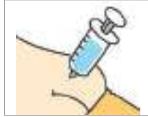
주사를 맞다 to get an injection