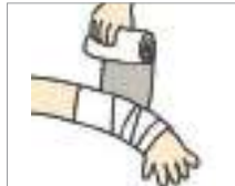
붕대를 감다 to wrap a bandage