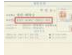
계좌 번호 account number