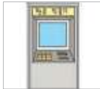
현금인출기 (ATM) ATM