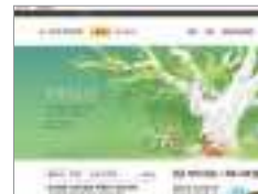
인터넷뱅킹 Internet banking