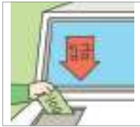
입금하다 to deposit