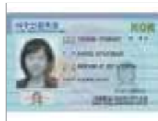
신분증 identification card