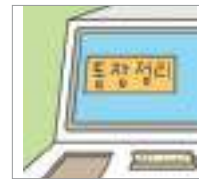
통장 정리 bankbook update