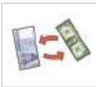
환전하다 to exchange