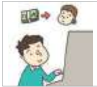
송금하다 to transfer

Let's find out about some expressions related to the banking business and ATM.