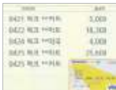
체크카드 debit card