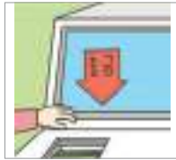
출금하다 to withdraw