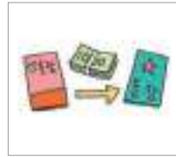
계좌 이체 account transfer