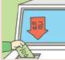
입금하다 to deposit