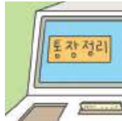
통장 정리를 하다