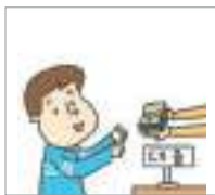
대출하다 to loan