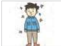
깔끔하다 to be tidy