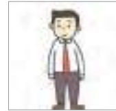
넥타이를 매다 to tie a tie