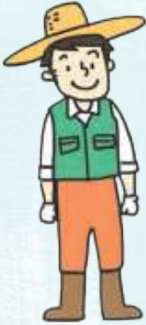
농업 agricultural industry