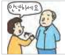
예의가 없다 to be rude