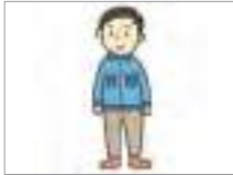
작업복 work clothes

What clothes should we wear in the company? Let's find out about vocabulary related to clothing.