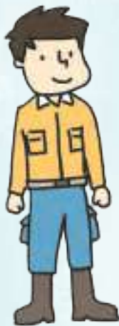
제조업(밀링 작업) manufacturing industry (milling)