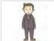
단정하다 to be neat