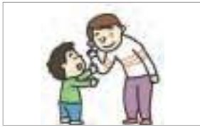
존중하다 to respect