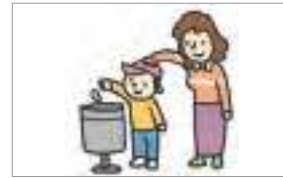
칭찬하다 to give compliments