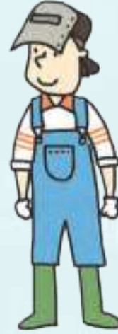
제조업(용접) manufacturing industry (welding)