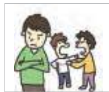
불쾌하다 to be unpleasant