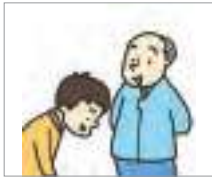
예의가 있다 to be polite

What should we do when we meet people in public places or in workplaces? Let's find out the vocabulary related to attitude.