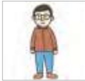
단추를 잠그다 to button up