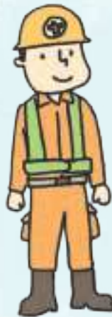
건설업 construction industry