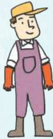
어업 fishing industry