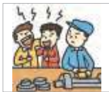
피해를 주다 to harm someone