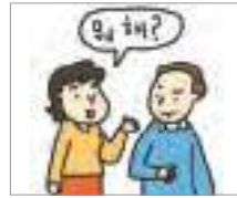
반말을 하다 to talk down