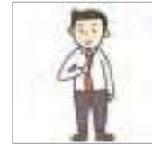
넥타이를 풀다 to untie a tie