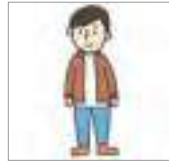
단추를 풀다 to unbutton