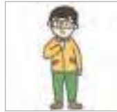
지퍼를 올리다 to zip up