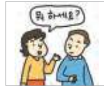
존댓말을 하다 to use honorifics