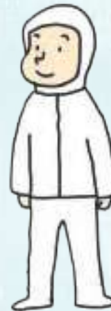
유통업(제품 포장) distribution industry (packaging)