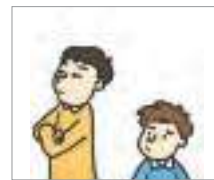
무시하다 to ignore