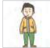
지퍼를 내리다 to unzip