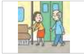
배려하다 to considerate