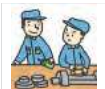
함부로 하다 to behave arrogantly