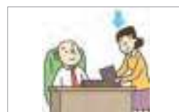
부하 one's junior