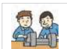
분위기가 좋다 to have a good atmosphere