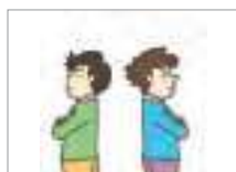
사이가 나쁘다 to be on bad terms