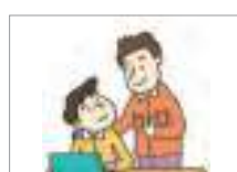
격려하다 to encourage