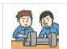
분위기가 나쁘다 to have a bad atmosphere