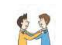
서로 위해주다 to care for each other