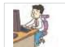
규율이 엄격하다 to be strict