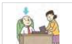
상사 one's senior