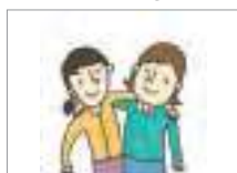
사이가 좋다 to get along