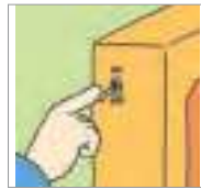
내리다 to switch off