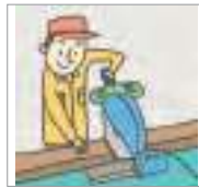
사용하다/쓰다 to use