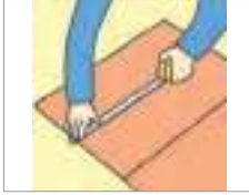
재다 to measure

Let's find out what expressions are needed to do the packaging work.