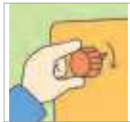
돌리다 to turn