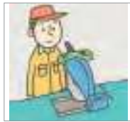
작동하다 to operate

Let's look at some of the expressions related to machine operation.