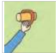
걸다 to hang