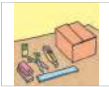
제작하다 to make