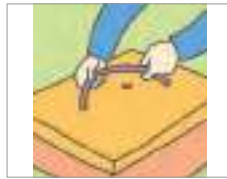
조절하다 to adjust