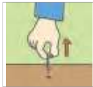
빼다 to pull out