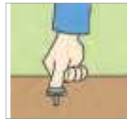
뽑다 to pull out