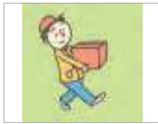
옮기다 to move