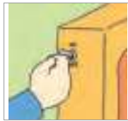
올리다 to switch on