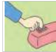
누르다 to press