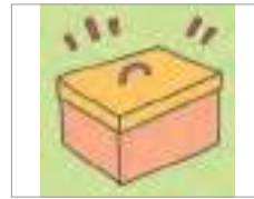
완성하다 to complete