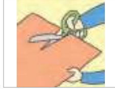
오리다 to cut out