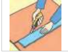
자르다 to cut