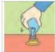
끼우다 to put in