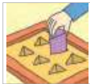
적재하다 to load