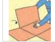
접다 to fold