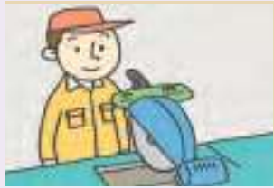
작동하다 to operate