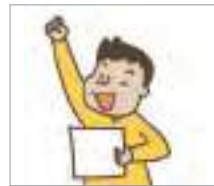
합격하다 to pass an exam