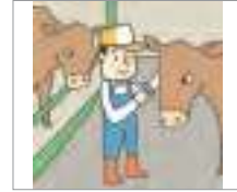
축산업 meat and dairy industry