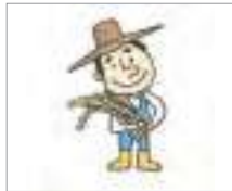
농업 agriculture industry