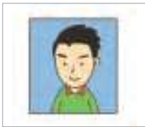
증명 사진 identification picture