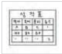
성적표 report card