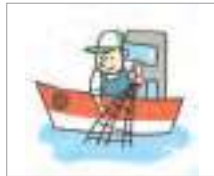
어업 fishing industry