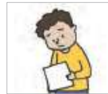
불합격하다 to fail (an exam)