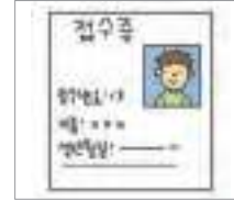
접수증 proof of application