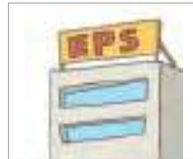
고용허가제 the Employment Permit System