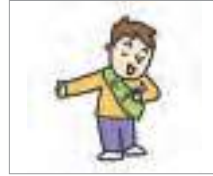
서비스업 service industry