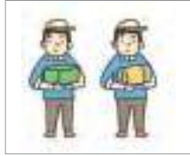
제조업 manufacturing industry

The following are various expressions related to Employment Permit System. Let's study what they are.