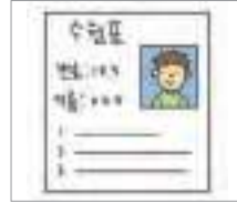
수험표 test identification slip