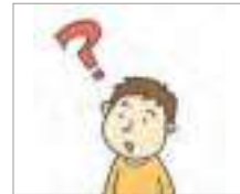
문의하다 to make inquiries