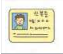
신분증 identification card

Shall we take a look at some expressions about EPS-TOPIK?