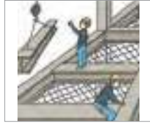
건설업 construction industry