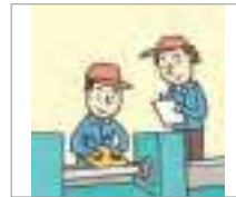
수습 기간 period of probation