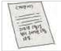
계약 기간 period of employment