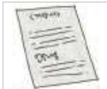
업무 내용 details of work