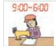
근무 시간 working hours