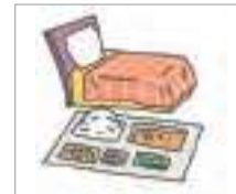
숙식 room and board