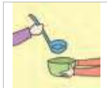
제공하다 to offer; to provide