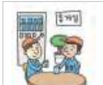
휴식 시간 rest breaks