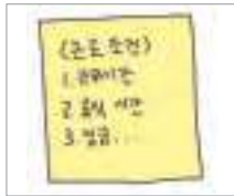
근로 조건 working conditions

The followings are various expressions related to working conditions. Let's find out what they are.