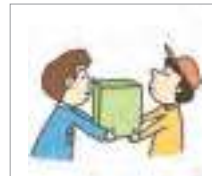
부담하다 to burden; to bear