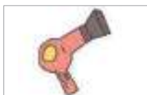
헤어드라이어 hair dryer