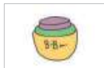
화장품 cosmetics (skin care)