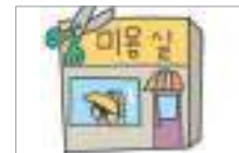
미용실 hair salon