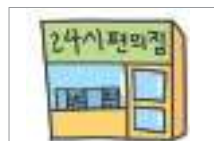
편의점 convenience store