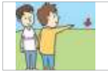
저기 over there