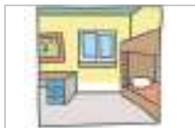
기숙사 dorm (dormitory)