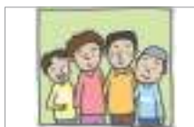
가족사진 family picture