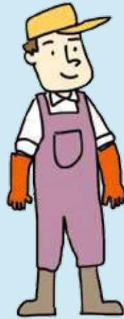
어업 Industri Perikanan