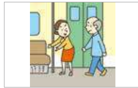
배려하다 tenggang rasa/mengalah