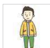
지퍼를 내리다 menurunkan resleting