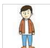
단추를 풀다 melepas kancing