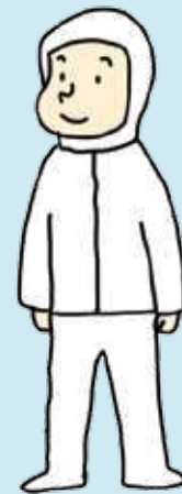
유통업(제품 포장) Industri Distribusi (Pengemasan)