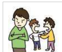
불쾌하다 merasa tidak senang/ enak/nyaman