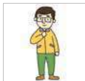
지퍼를 올리다 menaikkan resleting