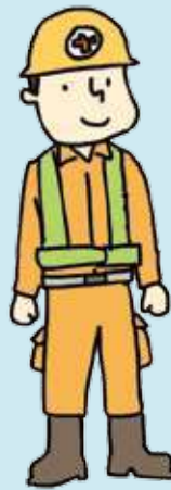
건설업 Industri Konstruksi