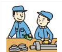
함부로 하다 melakukan secara sembarangan