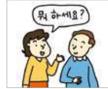
존댓말을 하다 berbicara dalam bentuk hormat