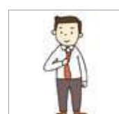
넥타이를 풀다 mencopot/ melepas dasi

Coba kerjakan soal tanpa melihat kosakata pada bagian sebelumnya.