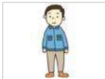
작업복 pakaian kerja