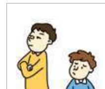
무시하다 mengabaikan/ mengacuhkan