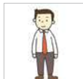
넥타이를 매다 memakai dasi