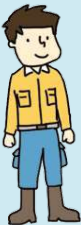
제조업(밀링 작업) Industri Manufaktur (Penggilingan)