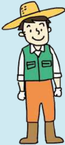
농업 Industri Pertanian