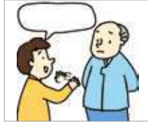
예의가 없다 tidak sopan