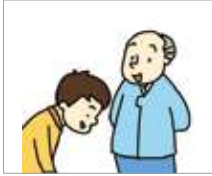
예의가 있다 sopan

Mari kita lihat kosakata yang berhubungan dengan sikap.