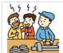
피해를 주다 merugikan/ mengganggu