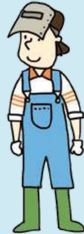
제조업(용접) Industri Manufaktur (Pengelasan)