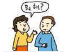
반말을 하다 berbicara secara informal