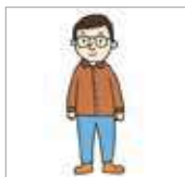
단추를 잠그다 memasang kancing